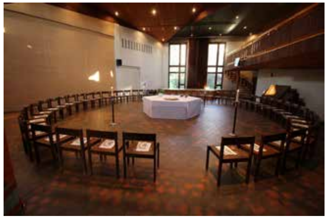
Der «Abendmahlssaal» am Gründonnerstag. Dieses Mal sind über 60 Menschen gekommen.