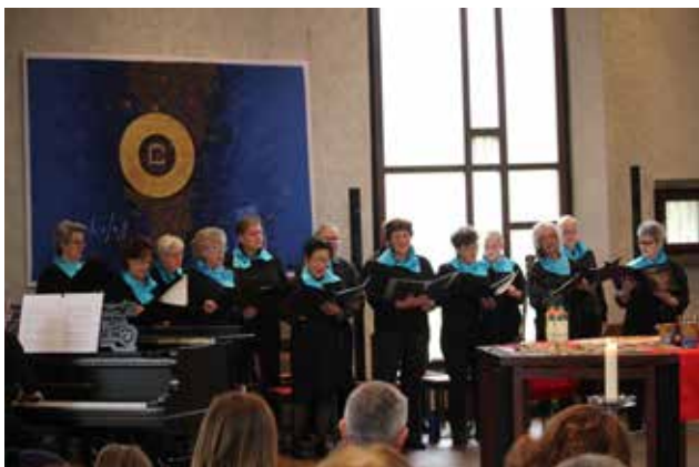
Der Gospelchor Dreikönig gestaltet die Feier musikalisch.