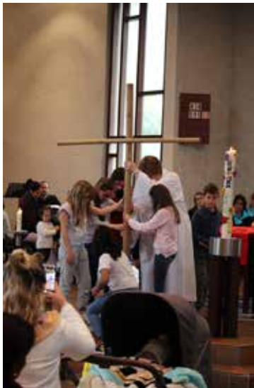
Palmsonntag: 4.-Klässlerinnen lesen und gestalten die Passionsgeschichte.