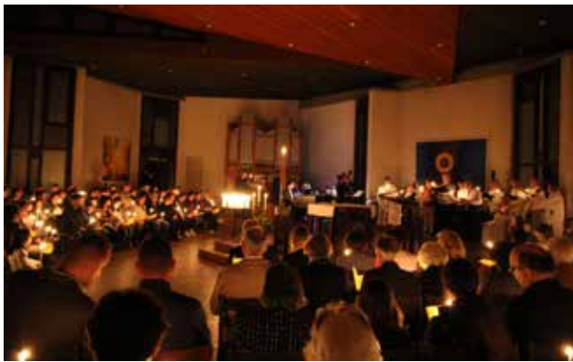
«In deinen Toren wird' ich stehen...»: Projektchor und Musiker/innen tragen die Feier. Ihnen und allen anderen Engagierten in der Fastenzeit, in der Hl. Woche, an Karfreitag und Ostern – «auf der Bühne» und dahinter – ein ganz herzliches und grosses Merci! Schön, dass Ihr da seid!