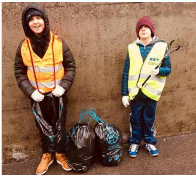
Zwei «Ritter der Strasse»: 5.-Klässler bei der RU-Aktion «Rettet unsere Zukunft». Merci den engagierten Kindern!