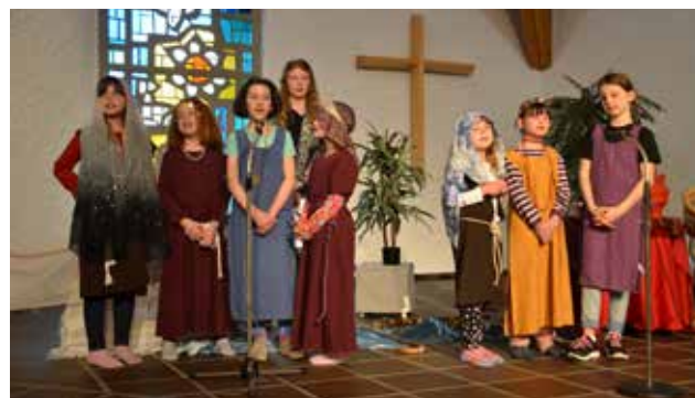
Die Kinder vom Musicaltreff sangen für die blinden und mehrfachbehinderten Kinder in Varna. Sie haben Fr. 517.60 erspielt.