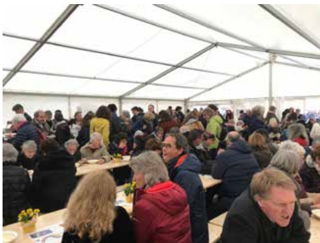
Nationaler Suppentag in Bern: Teilen, Gespräch, gemeinsamer Ausblick...

Die Verheissung Gottes bedeutet Leben in Fülle für alle Menschen, aber besonders für die Benachteiligten – konkret Land, Nahrung und die Gewährung der Menschenrechte. Fastenopfer war auf den Philippinen bereits aktiv zur Zeit der Diktatur Marcos (1972–1986). Danach musste das Volk Schritt für Schritt wieder ein Stück Demokratie lernen. Im Zentrum stand das Empowerment der Benachteiligten. Werden die Menschenrechte heute besser geschützt?