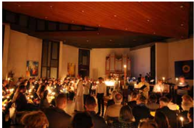
In der ökumenisch gestalteten Osternacht wurden Leben und Befreiung in der übervollen Kirche gefeiert...