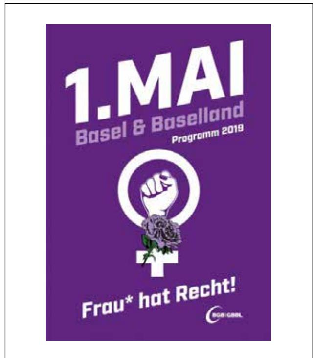
Die Pfarrei Dreikönig unterstützt die Rechte von Arbeitnehmer*innen, Sozialhilfeempfänger*innen und von an den Rand Gedrängten. Die 1.-Mai-Demo startet um 13.30 Uhr ab Bahnhof Liestal, Kundgebung und Festwirtschaft ab 14.00 Uhr in der Rathaustrasse mit Musik von Famiglia Rossi und Brazz Attack.