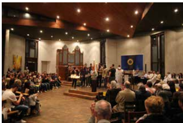
Die Ehrung mit der Überreichung der alten Osterkerze von 2018 ging dieses Jahr an die gesamte Pfadi Koinos für das ausserordentliches Engagement von Jugend und Kindern, für den herausragenden Einsatz als Jugendbund durch Jahrzehnte: Einsteher füreinander als junge Menschen in Offenheit, Toleranz, weltweiter Verbundenheit und in der Förderung der Schwachen; und die Lebensparole „Allzeit bereit!“ die die Jugendlichen in der Pfarrei immer wieder unter Beweis stellen. Merci beaucoup! Macht weiter so!