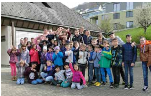
Do you speak chicken? Yes i do! Fröhliche Osterkindertage 2019.