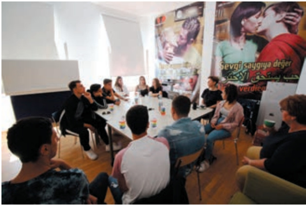
Workshop beim LSVD Berlin-Brandenburg.

Parolen der «neuen Rechten» öffentlich auf Plätzen, in Sälen, Parlamenten und in Internetforen salonfähig geworden sind. Der Workshop in der Geschäftsstelle des Lesben- und Schwulenverbandes Berlin-Brandenburg bot den Jugendlichen zum Themenkreis Identität, Gender und Toleranz die Möglichkeit, Fragen zu stellen, eigenes Wissen zu testen und miteinander ins Gespräch zu kommen.