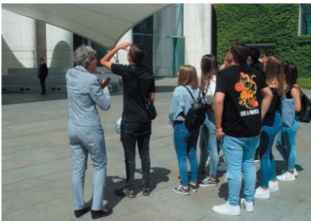
Im Ehrenhof des Bundeskanzleramtes.