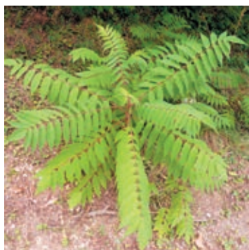
Essigbaum ( Rhus typhina )