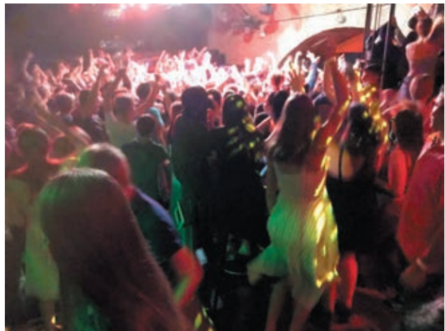
Party mit 1200 Jugendlichen auf verschiedenen Floors des Clubs Matrix.

Nachdenklich und betroffen machte die Führung über das Gelände der KZ-Gedenkstätte Sachsenhausen in der nördlich von Berlin gelegenen Stadt Oranienburg. Die Konfrontation mit dem Schicksal vieler Tausender Menschen an diesem Ort des Schreckens und des unermesslichen Leides ist heute mehr denn je wieder eine Mahnung, den Anfängen zu wehren, die europaweit mit den widerwärtigen