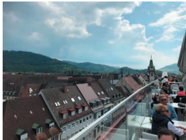
Von der Terrasse des Skajo den Blick auf die Stadt geniessen.