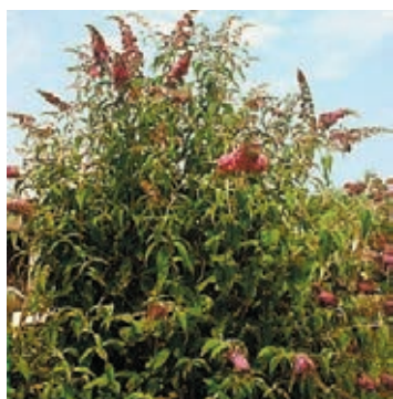
Sommerflieder ( Buddleja davidii )