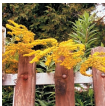
Nordamerikanische Goldruten ( Solidago canadensis , Solidago gigantea )

Um die weitere Verbreitung aus dem Siedlungsgebiet in die umliegende Natur zu unterbinden, empfiehlt es sich, diese Problempflanzen aus unseren Gärten zu entfernen. Folgende Arten sind auch aus Frenkendorf bekannt: