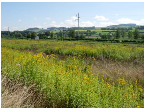
Buntbrache im Broyetal