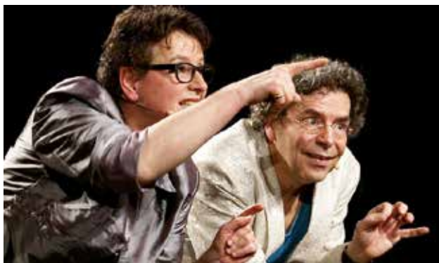
Komisch, bissig, pfiiffig... Das Kabarett Birkenmaier zum Thema Frau und Kirche u.a. anlässlich des Jubiläums des Frauenvereins im Zentrum Dreikönig am Pfarrefest: Sonntag, 3. November, 16.00 Uhr – Eintritt frei! (Kinderbetreuung ist gewährleistet).