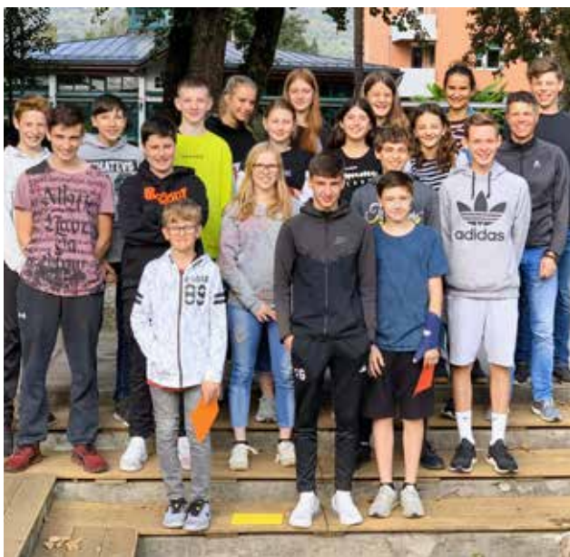
Grüsse aus dem Konfirmandenlager vom Gipfel des Monte Caslano. Herzliche Einladung zum Begrüssungs-Gottesdienst der neuen Konfirmandenklasse am Sonntag, 20. Oktober, 17 Uhr in der Kirche Füllinsdorf.

Am Sonntag: Wir treffen uns um 14. Uhr in der Kirche Füllinsdorf zur Hauptprobe. Um 17 Uhr findet der Gottesdienst in Füllinsdorf statt, Ende ca. 18.30 Uhr. Weitere Infos und Anmeldung: Pfarrer Peter Leuenberger, Tel. 061 901 14 40; SMS 078 653 05 86, Mail: peter.leuenberger1@bluewin.ch