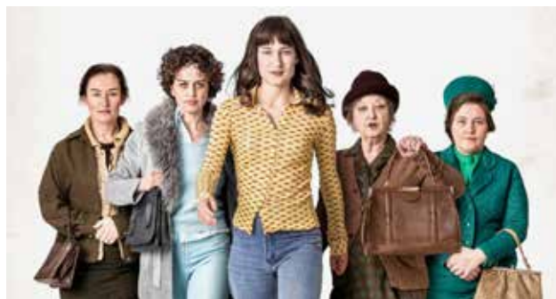
«Die göttliche Ordnung»: Ein verfilmtes Stück Schweizer Geschichte über Power, Beharrlichkeit und Mut von Frauen. Gab es neulich in der Reihe film & wine zu sehen. Frauliche Intelligenz und Power wird auch im Kirchgemeinderat Dreikönig dringend gebraucht. Einfach melden. Frau (und auch Mann) darf gerne «schnuppern» kommen.

Der Kirchgemeinderat braucht dringend Verstärkung. Dabei wären engagierte Frauen ein grosser Gewinn mit ihren Ideen und ihrem Können. Zwei Plätze sind derzeit vakant; Ressorts werden je nach Zuwachs im Rat neu oder anders verteilt.