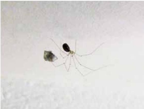
... und nach der Nahrungsaufnahme