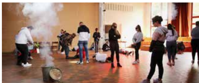
Simulationsspiel «Stationen einer Flucht» am Projekttag Flucht und Asyl Anfang September mit Engagierten der Schweizerischen Flüchtlingshilfe und den Jugendlichen der Firmjahrgänge 2020 und 2021: «Überfall auf das Dorf – Beginn der Flucht.»

sich «heraushält» und wieder wie grossenteils in ihrer Geschichte zu einem von den Eliten geschätzten macht- und systemstabilisierenden Faktor wurde und wird – und sich zurecht dem Vorwurf aussetzen muss, Opium des Volkes zu sein. Nein, es sollte die These zu denken geben, dass biblische, jüdische, christlich-jüdische «Religion» als ein Antiprojekt gerade gegen Religionen im Dienst von Herrschenden und ausserhalb von deren Einflussgebiet startet: Dafür stehen die nicht hintergehbare Exodustradition als bleibender Auftrag zur Befreiung von Menschen und Natur und die abrahamitische Tradition in ihrer radikalen Ablehnung jedweder Menschenopfer im Namen welchen hehren Zieles auch immer. (Es ist nicht der biblische Befreiergott, der Abraham befiehlt, den Sohn zu opfern, sondern der «Religionsgott», der noch Abrahams Denken und Handeln bestimmte, von dem er und seine Frau Sara sich aber anti-religiös lossagen. Im Text markiert durch einen Wechsel des Wortes).