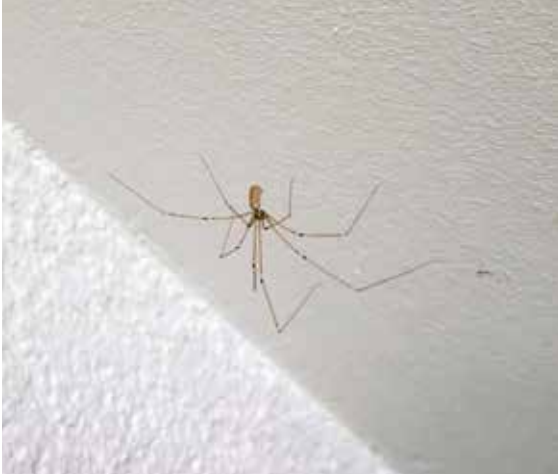
Eine Zitterspinne: vor ...