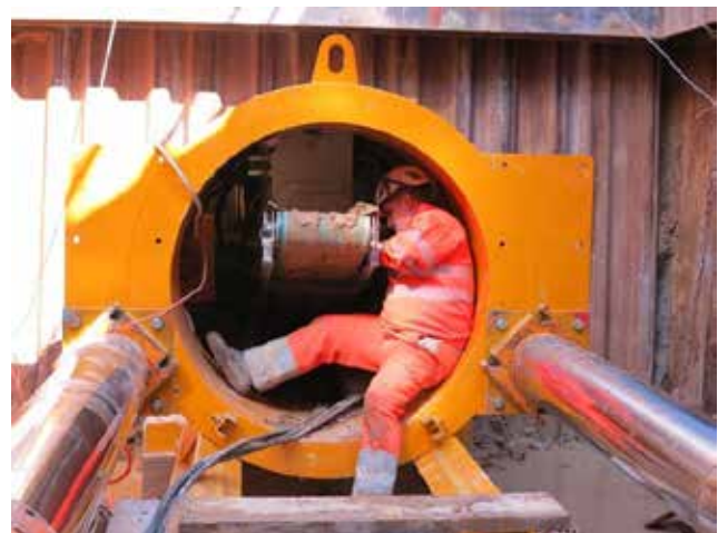
Viel Platz bleibt nicht beim Ein- und Ausstieg.

► Stand des Vortriebs in Richtung Hülftenstrasse am 27. März: 6 von 206 Meter ◀