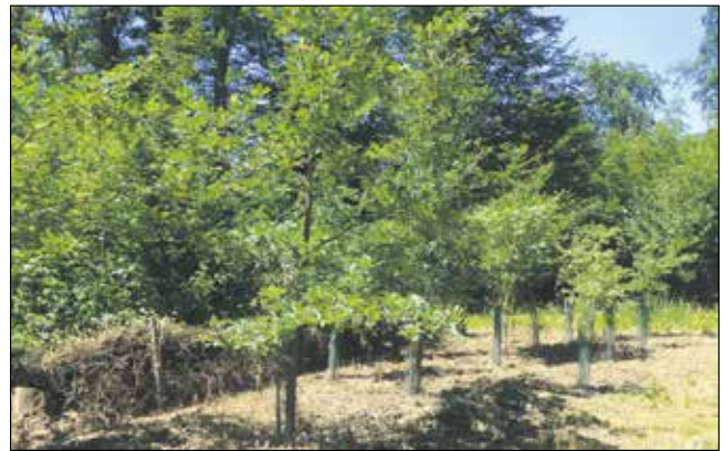
Neupflanzungen unterstützen einen stabilen Mischwald.

Das Waldkonzept sieht vor, kahl geschlagene Flächen konsequent mit resistenteren Baumarten zu bepflanzen. Das Holz wird, wenn immer möglich, in der Region oder zumindest in der Schweiz verkauft. Gefördert werden zudem regionale Wärmeverbände und die Verwen-