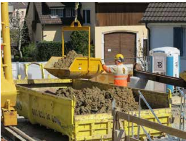
Das Ausbruchmaterial landet in der Mulde.