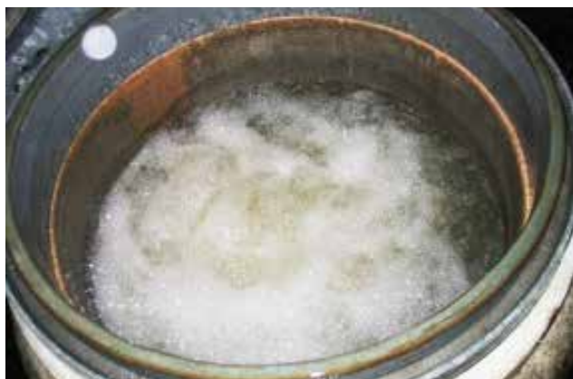
Natürliches Quellwasser mit Luft

Die Gemeinde Frenkendorf verfügt über drei Wasserbezugsorte: das Grundwasserpumpwerk Wanne in Füllinsdorf, die Quellen Rappenfluh und Wolfenried sowie der Wasserbezug von Pratteln. Unser Quellwasser versorgt hauptsächlich den oberen Dorfteil in der sogenannten Hochzone. Dank 28 Regentagen seit anfangs Jahr mit total ca. 170 Litern Niederschlag pro Quadratmeter und einem Maximum am 4. Februar 2020 mit 16 Litern liefern unsere Quellen wieder ausreichend Wasser. Das war leider in den letzten beiden Jahren nicht mehr der Fall. Im Moment können wir die ganze Gemeinde mit Quellwasser versorgen. Dies ist sehr erfreulich.