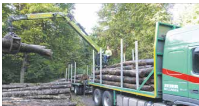
Der Zweckverband wird auch die Holzvermarktung vereinfachen.

Frenkendorf: Donnerstag, 28. Mai 2020, 18 Uhr, Bürger- und Kulturhaus, Hauptstrasse 1