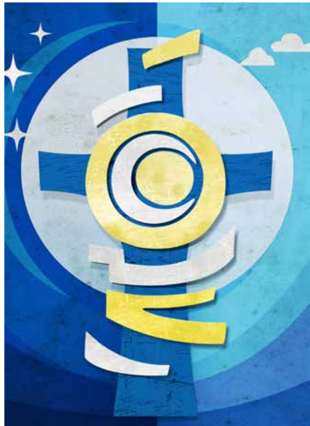
Bruder Sonne – Schwester Mond

Unsere Osterkerze heisst in Anlehnung an Franz von Assisi und seinen Lobpreis der Schöpfung «Schwester Sonne und Bruder Mond». Sie erinnert uns daran, dass alles zusammengehört, Schatten und Licht, Tag und Nacht, Feuer und Wasser, Tod und Leben. Es