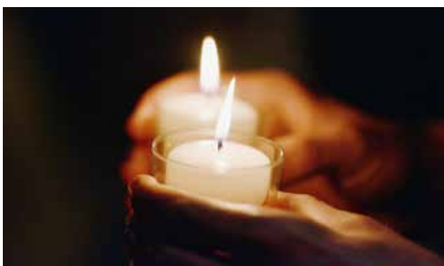
Gott hat uns nicht einen Geist der Verzagtheit gegeben, sondern den Geist der Kraft und der Liebe und der Besonnenheit. Die Bibel: 2. Tim. 1,7