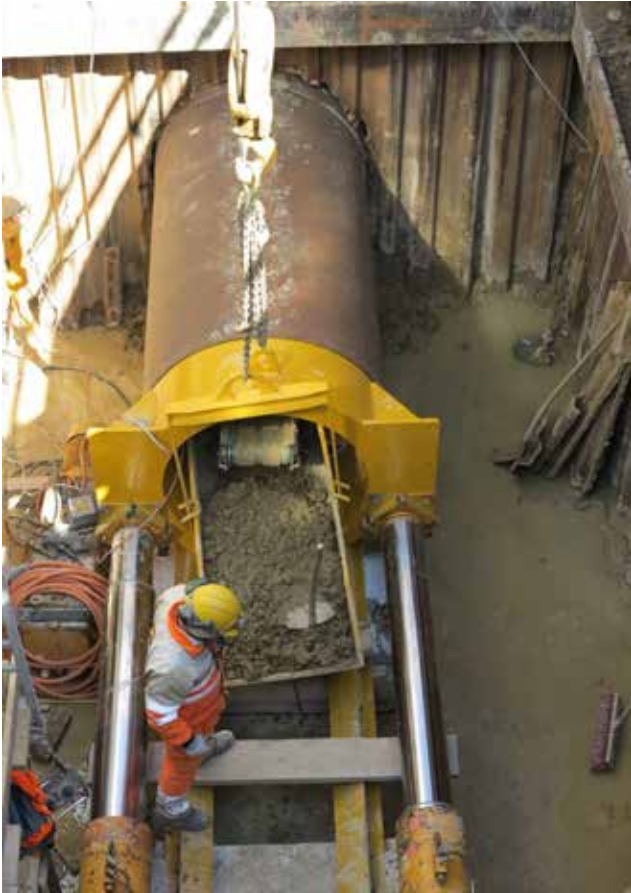
Das Maschinenrohr wird als Erstes vorgetrieben.

Markant ragt seit einigen Tagen das gelbe Stahlskelett, der Portalkran von Grund- und Tiefbau AG Basel, über der Adlergasse in Frenkendorf. Darunter öffnet sich eine Grube in der Grösse von 300 Kubikmetern Inhalt. Auf deren Boden stehen grosse hydraulische Pressen die bis auf vier Meter ausgefahren werden können. Als erstes wird das Maschinenrohr (Stahlrohr) mit integriertem Stollenbagger vorgetrieben. Dort drin gräbt sich der Vortriebspolier Zentimeter um Zentimeter in Richtung Hülftenstrasse. Drei Meter lange und aus hochwertigem Stahlbeton gegossene Vortriebsrohre werden anschliessend mit den Pressen Stück für Stück nachgetrieben. Das Ausbruchmaterial wird mit einem Förderband auf die sogenannte „Lore“ geladen, welche mittels Seilwinde aus dem Kanal und via Portalkran über Tage gefördert wird. Von dort aus wird das Material mit dem Lastwagen zur Deponie geführt.