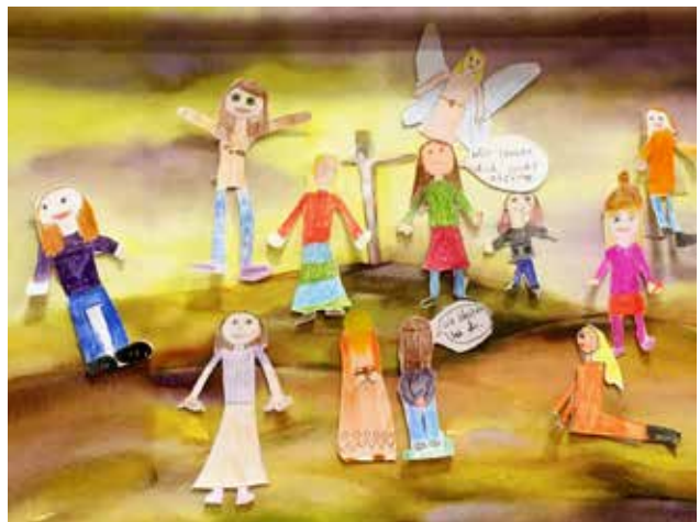
Selbstporträts der Kinder.