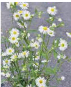
Einjähriges Berufkraut ( Erigeron annuus )