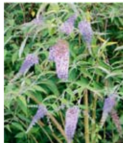
Sommerflieder ( Buddleja davidii )