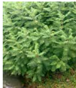
Essigbaum ( Rhus typhina )