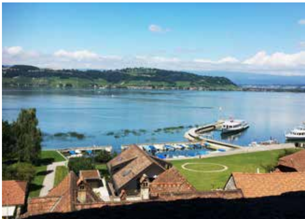
Blick über den Murtensee zum Mont Vully

Nächste Montags-Wanderung am 4. Oktober.