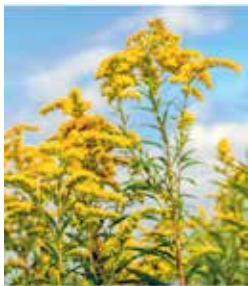
Nordamerikanische Goldruten ( Solidago canadensis , S. gigantea )

Die Bekämpfung von Neophyten ist ein langjähriger und aufwändiger Prozess, weswegen die weitere Verbreitung aus dem Siedlungsgebiet in die umliegende Natur unterbunden werden sollte. In Frenkendorf sind u.a. folgende Arten anzutreffen: