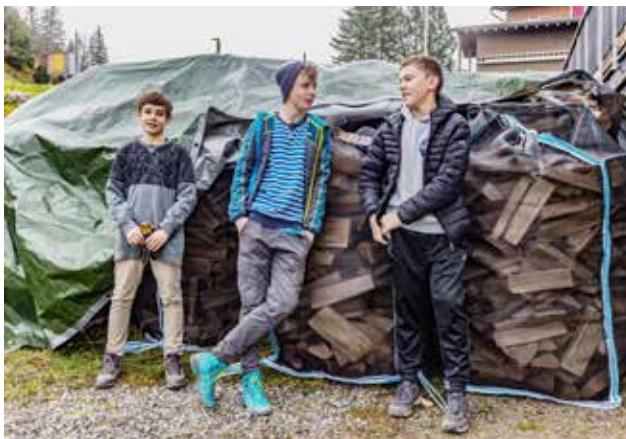
Auch in diesem Jahr gehts ins Holzerweekend, damit es im Naturfreundehaus Röthen auf der Klewenalp im Winter warm bleibt. Rund 12 Ster Holz müssen schön geordnet im Keller versorgt werden.