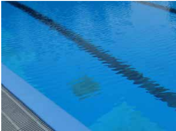
Fest installiertes Schwimmbecken

Das vorliegende Merkblatt richtet sich an Inhaber von privaten Schwimmbecken und von mobil aufstellbaren Pools. Gezeigt sind die Grundsätze zum umweltgerechten Umgang mit Becken-, Pool- und Reinigungswasser.