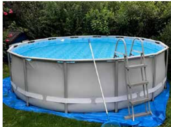
Mobil aufstellbarer Pool im Garten