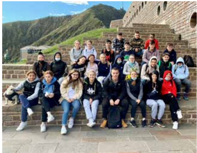
Ausflug zur Bottakirche auf dem Monte Tamaro.