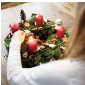
Wir wünschen allen einen lichtvollen Advent

Für religiöse Veranstaltungen wie Gottesdienste (auch bei Trauerfeiern und Hochzeiten) bis 50 Personen gelten: \frac{2}{3} Auslastung, Kontaktdaten, Maskenpflicht, Abstand halten. Ab 50 Personen, auch für Theater und Konzerte: Zutritt nur mit Zertifikat und Schutzmaske. Auf unserer Homepage finden Sie die detaillierten Angaben zu den Gottesdiensten, welche nur mit Zertifikat besucht werden können.