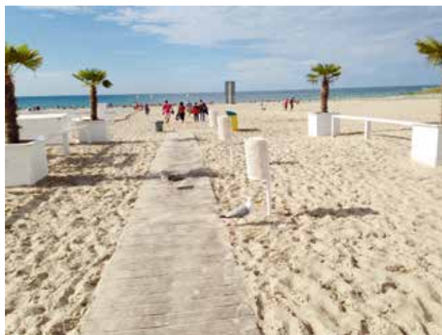
Strandbad Warnemünde an der Ostsee bei Rostock Ende Juli 2013: Willkommen zurück aus den Ferien!