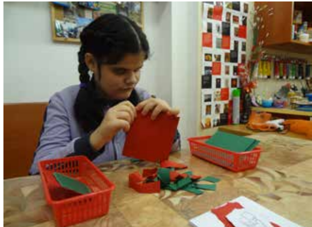
Desi bastelt Weihnachtskärtchen für uns ...