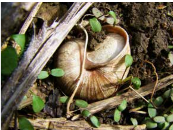
Weinbergschnecke mit dickem Kalkdeckelchen

Die Weinbergschnecke raspelt mit ihrer Raspelzunge/Radula, die mit mehreren Tausend Zähnchen besetzt ist, abgestorbene Pflanzenreste, tote Pflanzenstängel, Algen, Totholz, Steine, Kompostmaterial ab, auch Nacktschneckeneier werden in den Schlund geschaufelt und ... daraus entsteht wieder Humus. (Näheres: Universität Hamburg, Forschung zur Raspelzunge von Landschnecken.)