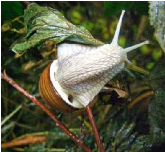
Weinbergschnecke beim Fressen