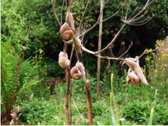
Weinbergschnecken, an abgestorbenen Stängeln raspelnd