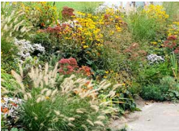
Gartenplanung Gartenbau Gartenpflege