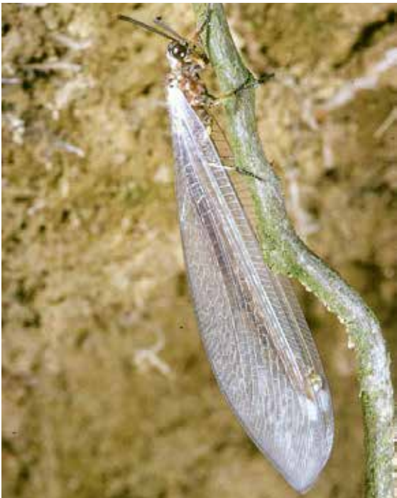
Ausgewachsene Ameisenjungfer

Im sandigen Boden an einer regengeschützten, sonnigen Stelle kann man diesen von den Kleintieren gefürchteten Jäger antreffen. Der Ameisenlöwe ist die Larve der Ameisenjungfer.