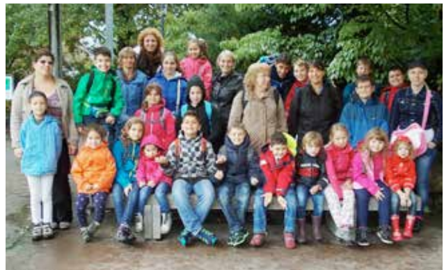
Kinder und Betreuerinnen während des Herbsttageslagers, das im Oktober 2014 zum ersten Mal während einer Woche durchgeführt wurde: Es gab ein spannendes Programm und vor allem viel Spass dabei. Für dieses Jahr werden wieder Engagierte gesucht, die mitgestalten wollen.

Herzliche Einladung an alle theologisch interessierten und offenen Menschen!