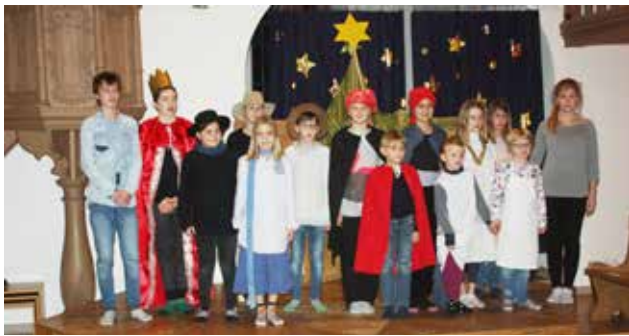
Die Einnahmen des Weihnachtsspiels zugunsten des OESA, Ökumenischer Seelsorgedienst für Asylsuchende der Region Basel, haben Fr. 788.30 ergeben.