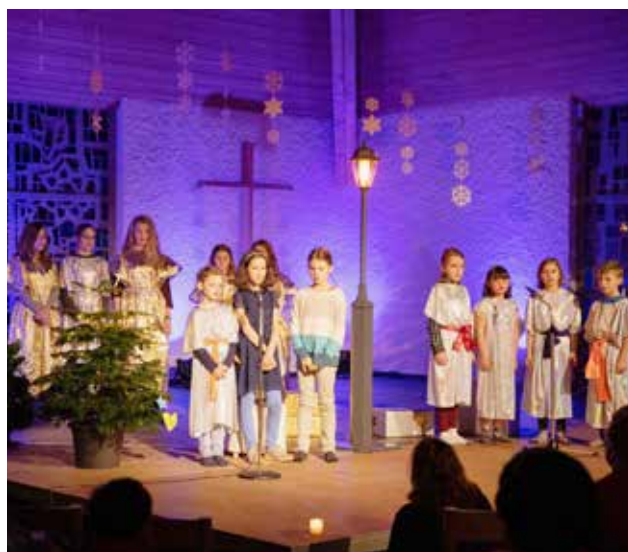
Die Einnahmen der Aufführungen des Weihnachtsmusicals zugunsten der Christoffel Blindenmission haben Fr. 1452.85 ergeben.