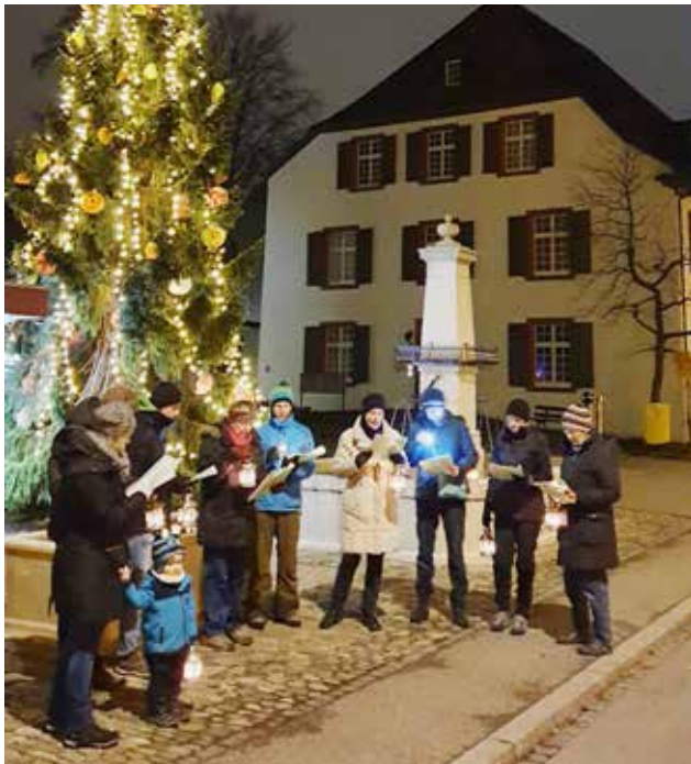
Weihnachtliche Stimmung beim Kurrendensingen.