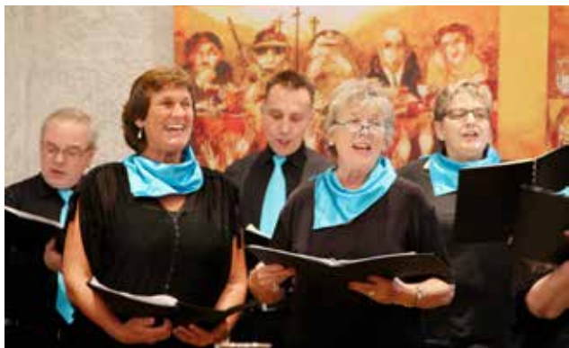
Der Gospelchor Dreikönig wird im feierlichen Firmgottesdienst am Samstag, 26. Januar, 15.30 Uhr dabei sein. Herzlich willkommen!