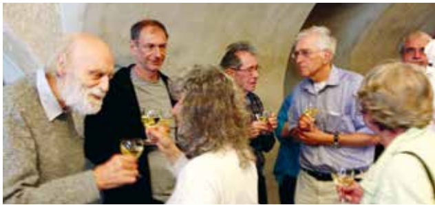
Abendlicher Apéro während des Collège de brousse: Ganz links Franz Hinkelammert, Ökonom, Philosoph und Befreiungstheologe aus Costa Rica.

zweiten Septemberwoche zu seiner jährlichen Fortbildung im Schloss Beuggen im deutschen Rheinfeldern traf.