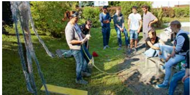
Firmandinnen und Firmanden besprechen sich im Rahmen des Kunstprojektes «Der aufrechte Gang». Das sonnige Wetter bot die besten Bedingungen, um im Freien mit Draht, Stahl und Beton zu schaffen.

lisieren, gerade auch von Menschen, die einmal am Boden waren. Dass es drei Figuren sind, entspricht eher zufällig dem Namen «Dreikönig» von Pfarrei und Zentrum. Dennoch lassen sie eine eigene Deutung der alten symbolischen Geschichte von drei Sterndeutern aus dem Osten zu, die sich aufmachen, einem Stern zu folgen und schliesslich in dem Haus einfacher Leute auf ein neugeborenes Kind treffen. Es heisst, dass sie, verändert und «aufgerichtet», auf einem anderen Weg nach Hause zurückkehren