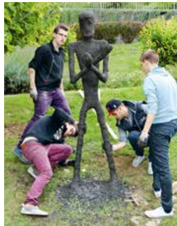
Am zweiten Projekttag der Firmlinge erhält eine der Figuren ihre Modellierung mit schwarzem Beton.

Es werden Menschen dargestellt, die sicher nicht dem Ideal eines falschen Heldentums entsprechen, aber den aufrechten Gang symbo-