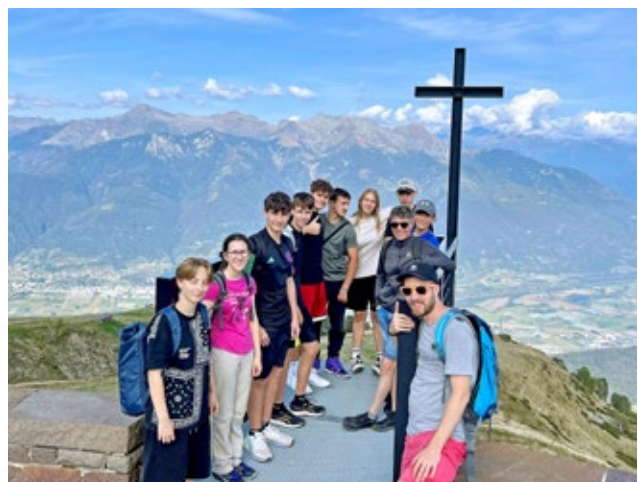
Liebe Grüsse aus dem Konflager im Tessin. Monte Tamaro