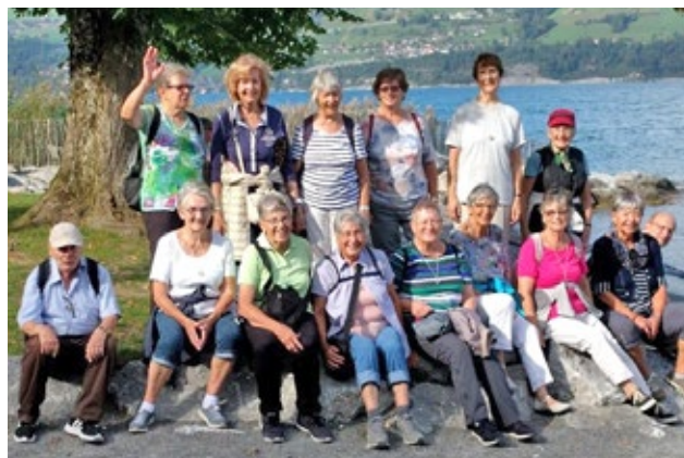
«Wandergruppe» kurz vor Faulensee.

Am Sonntag feierten auch wir den Bettag mit einem Gottesdienst mit Abendmahl und am Nachmittag genossen wir eine Fahrt mit Pferden – im Bödelitram und 4 Kutschen – durch Interlaken, Matten und Unterseen; herrlich! Die weiteren Ausflüge führten uns zum Harder (leider im Regen, aber trotzdem speziell), auf die Schynige Platte mit herrlicher Aussicht auf Eiger, Mönch und Jungfrau etc. Diese beiden Ziele erreichten wir mit der über 100-jährigen Standseilbahn (Harder), und der im Jahr 1893 erbauten Zahnradbahn (Schynige Platte) mit den alten Holzbänken. Noch eine spezielle Bahn konnten wir geniessen, nämlich die 1879 eröffnete Giessbachbahn, die älteste Standseilbahn der Schweiz, die noch in Betrieb ist. Diese führte uns von der Schiffsstation zum Giessbachhotel, von wo aus ein kurzer Spaziergang zu den Wasserfällen möglich war. Ja, Interlaken liegt zwischen zwei Seen; darum gönnten wir uns auch zwei Schifffahrten: Auf