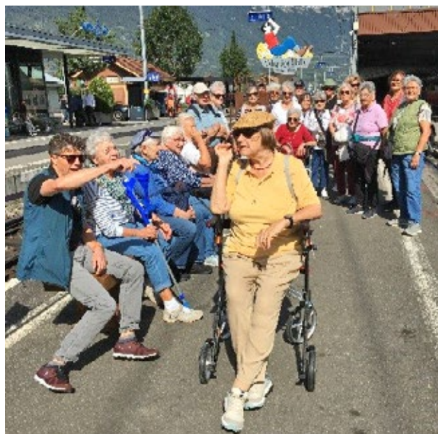
In Wilderswil beim Warten aufs Zügli zur Schynige Platte.

dem Brienersee mit Abstecher zum Giessbach und auf dem Thunersee mit Halt in Spiez. Von dort spazierten einige nach Faulensee, die anderen genossen eine Erfrischung im Hafbereich von Spiez. Mit dem Schiff ging es dann wieder gemeinsam zurück nach Interlaken. Auch am Freitag war für einige Spazieren angesagt auf dem bequemen Wanderweg dem Wasser entlang nach Bönigen. Eine andere Gruppe fuhr nach Habkern, um dort «eine ganz andere Welt» kennenzulernen. Wieder andere genossen einfach das Hotel oder einen Bummel durch Interlaken.