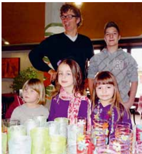
Kinder basteln für Kinder

Aber nicht nur Erwachsene und Jugendliche haben sich engagiert. Im Kurs «Kinder basteln für Kinder» bastelten Kinder schöne Karten,