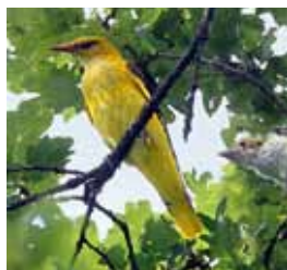
Pirol: Vogel des Jahres 2013