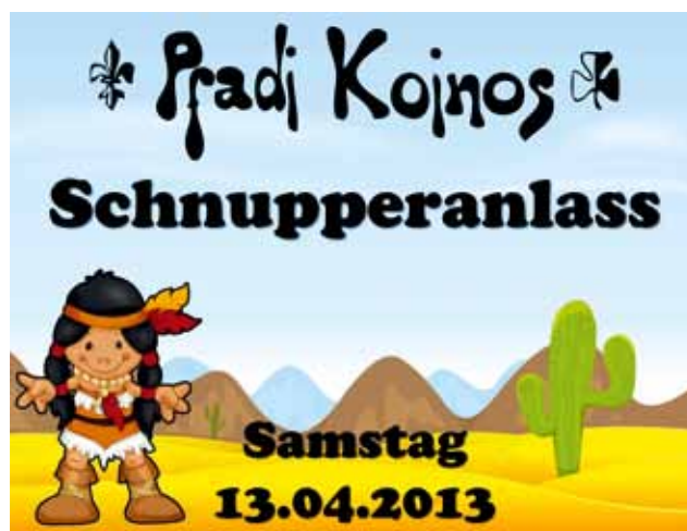
Schnupperanlass der Pfadi Koinos: Teilnahme ab 6 Jahren.

Ende: um 17.00 Uhr auf dem Dorfplatz in Frenkendorf.