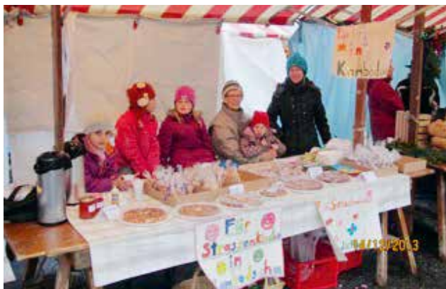
Schülerinnen und Schüler auf dem Frenkendorfer Adventsmarkt mit Kuchen und Bastelarbeiten für die Organisation «Goutte d'eau».

Der ökumenische Gottesdienst findet statt am Sonntag, 19. Januar, um 10.45 Uhr in der reformierten Kirche in Füllinsdorf. Herzliche Einladung!