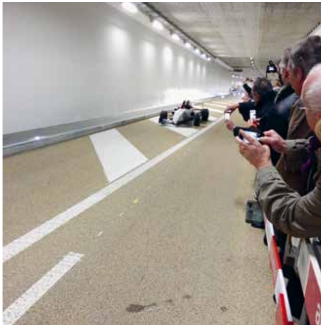
Rennwagen mit Erlaubnis zur Durchfahrt durch den Tunnel.

deutlich abgenommen. In diesem Jahr stehen noch diverse Arbeiten an der Oberfläche und umgebenden Knoten an und mit der Umgestaltung der Rheinstrasse steht die Realisierung eines gesamten Projektabschnitts noch bevor. Für Letzteres soll im kommenden Sommer ein neues Projekt öffentlich aufgelegt werden.