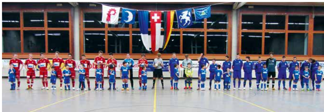
So ist die Vorstellung, wenn man ins Final kommt. FC Baden und Concordia Basel 2013.