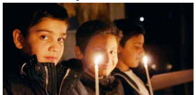
Jüngere Teilnehmer bei der adventlichen Roratefeier 2013.

Donnerstag, 16. Januar, 19.30 Uhr im Pfarreizentrum Dreikönig.