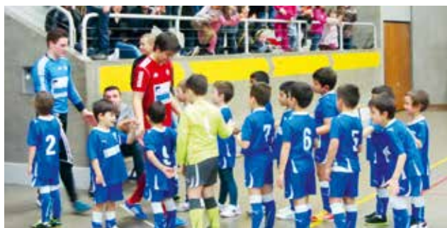
Und die Kleinen vom FC Frenkendorf stehen Spalier beim Einmarsch der siegreichen Mannschaften auch 2013, also so wie beim FC Basel im Joggeli.

zu bemerken, das Turnier wurde nicht gegründet, um nur die TOP FUSSBALLER für die Zukunft einmal in der Jugend bei uns in Frenkendorf gesehen zu haben. Nein, das Turnier bleibt das Turnier zur Besserung der Völkerverständigung. Und geht man zurück ins Jahr 1993, so war der Willkommensgruss vom Regierungspräsidenten Peter Schmid wie folgt: Fussball fasziniert während der Spielsaison Tausende von Zuschauern im In- und Ausland, ja in den vollen Stadien wie auch am Bildschirm. Im Anschluss an die eigentliche Freiluftsaison finden danach Hallenturniere grossen Anklang. Bei den Jugendlichen steht jedoch auch das Kennenlernen von anderen Kulturen und auch von Menschen aus anderen Regionen im Vordergrund. In der Zeit, wo Mannschaften aus Mlada Boleslav und Prag zu uns kamen, so war es das Kennenlernen einer Schweiz, die in einem kapitalistischen System ihr Leben hatte. Wir waren die Gastgeber und taten alles, dass sich alle so richtig bei uns wohlfühlen konnten. Gut, wir hatten Glück, dass eine Tschechin, die jedoch viele Jahre schon hier bei uns in Frenkendorf lebte, mit ihrem Mann gemeinsam das Wohlfühlen ermöglichte. Und so kann man sich auch noch über das Turnier informieren: http://trirhena.fc-frenkendorf.ch/ . Es versteht sich von selbst, dass nicht nur der Organisator, sondern auch die Mannschaften mit ihren Spielern sich freuten, wenn wie in den Vorjahren viele Zuschauer den Weg in die Sporthalle Egg finden könnten.