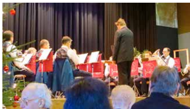
Brass Band Frenkendorf