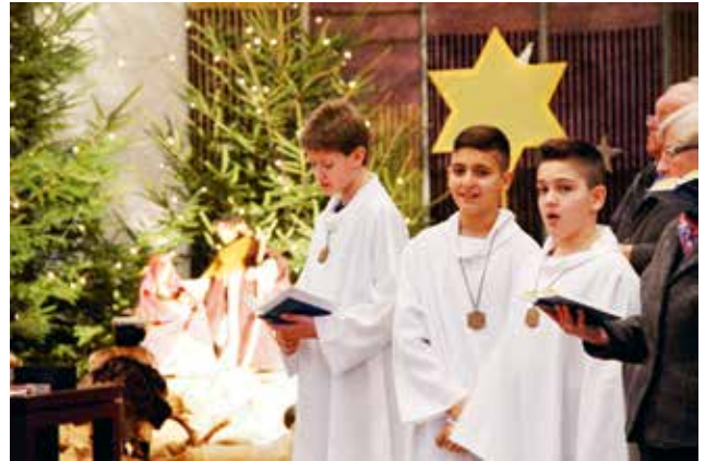
Menschen wünschen wir hoffnungsvolle Momente, Lebensmut und Kraft für das Jahr 2014.

Ministranten im Weihnachtsgottesdienst 2013. – Ausser ihnen haben sich viele Menschen aller Altersgruppen in der Advents- und Weihnachtszeit «vor und hinter den Kulissen» engagiert, Gutes getan, partizipiert ... Ein herzliches Merci dafür! Allen