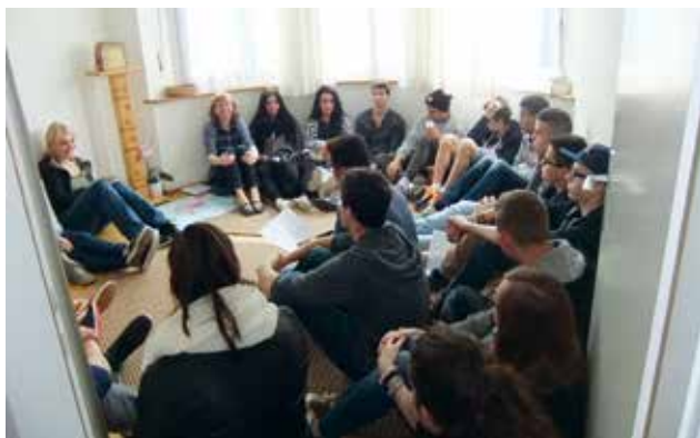
Austausch und entspannte Atmosphäre in der Scalabrinimission.

Im Rahmen des Themas «Flucht und Asyl» fand am vorletzten Samstag eine Exkursion von Jugendlichen der Firmjahrgänge 2015 und 2016 zum Ökumenischen Seelsorgedienst für Asylsuchende statt. Die Firmlinge hatten die Gelegenheit, die Beratungsstelle für Asylsuchende (BAS), den Ökumenischen Seelsorgedienst (OeSA) sowie das Empfangszentrum für Asylsuchende in Basel kennenzulernen, sowie persönlich mit Flüchtlingen ins Gespräch zu kommen.