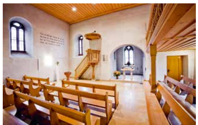
Unsere heimelige Kirche in Frenkendorf erhält im Sommer einen neuen Innen-Anstrich. Spenden sind willkommen! Bankverbindung: Basellandschaftliche Kantonalbank, 4410 Liestal / H, Ref. Kirchgemeinde Frenkendorf-Füllinsdorf, CH44 0076 9016 1104 3561 7 Konto 40-44-0)