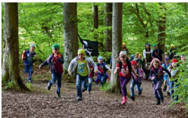
Die Piraten sind los: Schnupperanlass der Pfadi Koinos im Mai.