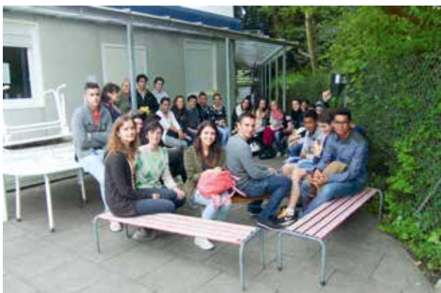
Firmandinnen und Firmanden der Kurse 2015 und 2016 beim Besuch des Ökumenischen Seelsorgedienstes für Asylsuchende (OeSA) beim Empfangszentrum an der Grenze.

Geleitet wurde der Nachmittag von drei engagierten Frauen, die der Scalabrinimission angehören. Die Frauen verstanden es, die Firmgruppe mit einer Leidenschaft und Begeisterung durch den Tag zu leiten und zu begleiten, die einen nachhaltigen Eindruck bei allen Beteiligten hinterliess.