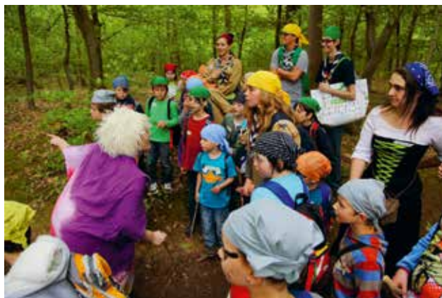
Da staunen die wilden Piraten nicht schlecht.