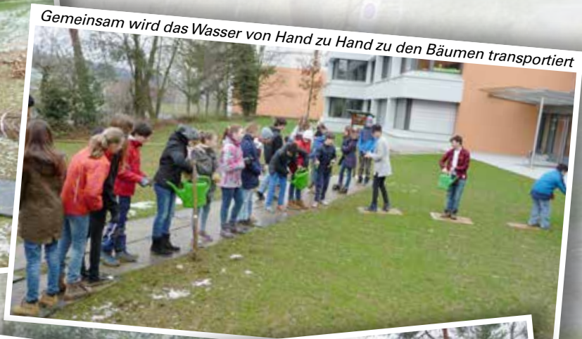
Gemeinsam wird das Wasser von Hand zu Hand zu den Bäumen transportiert