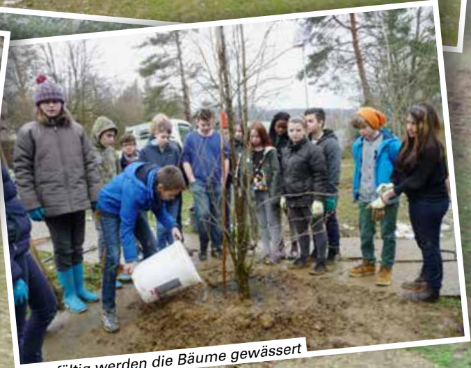
Sorgfältig werden die Bäume gewässert