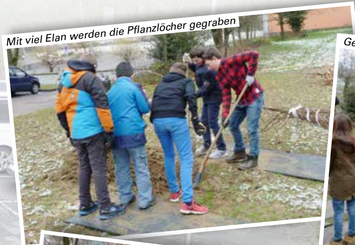
Mit viel Elan werden die Pflanzlöcher gegraben