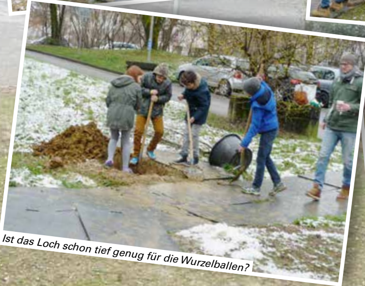
Ist das Loch schon tief genug für die Wurzelballen?