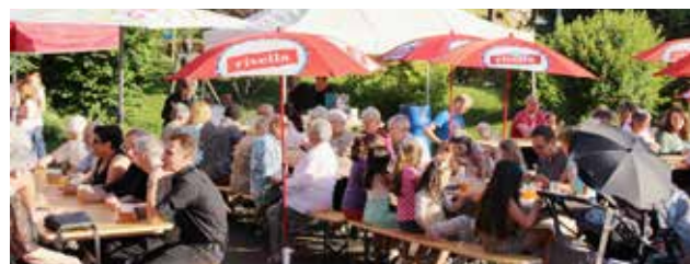
Schöne Stimmung am Sommerfest 2015.