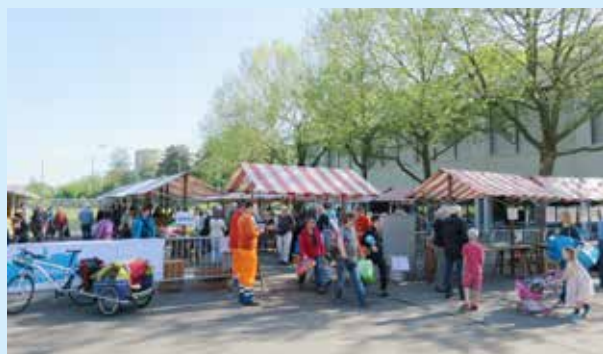
Die Eingangskontrolle stellt sicher, dass nur brauchbare Sachen angeboten werden.