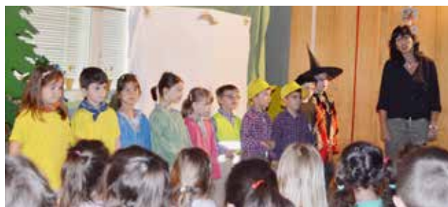
Aus dem Kindergarten von Y. Stürchler, der gestiefelte Kater