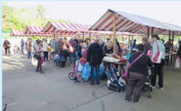
Zwischen den Marktständen mit vielen bunten Tauschwaren herrscht ein reges Treiben.

Besten Dank allen Spenderinnen und Spendern sowie allen Beteiligten, die zum Gelingen des Anlasses beigetragen haben.