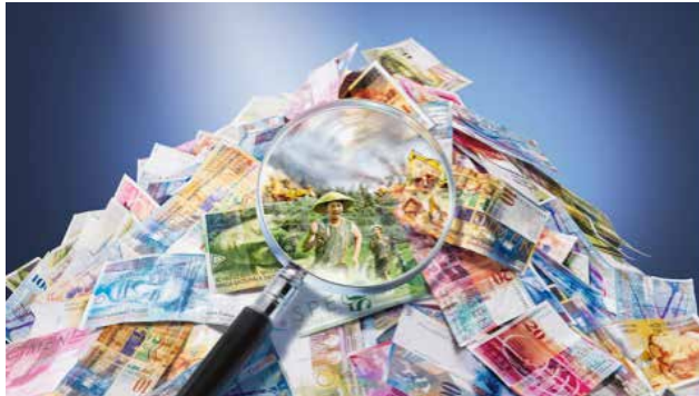
Das Motiv des Aktionsplakates der Aktion Fastenopfer weist eindringlich auf das Problem und Verbrechen des Land-Grabings hin. Auch Schweizer Banken haben ihre Finger im Spiel.

In Indonesien steigt die Nachfrage nach Flächen für den Anbau von Ölpalmen rasant. Ausländische Investoren oder inländische Eliten haben sich hunderte von Quadratkilometern Land gesichert. Sie wollen Palmöl ernten und als Rohstoff beispielsweise an die Nahrungsmittel- und Kosmetikindustrie verkaufen. Hinter den Investitionen stecken auch Schweizer Banken. Was den Interessen der Investoren dient, verletzt aber das Recht auf Nahrung vieler Menschen vor Ort.