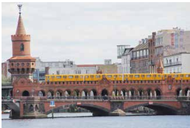
Oberbaumbrücke in Berlin