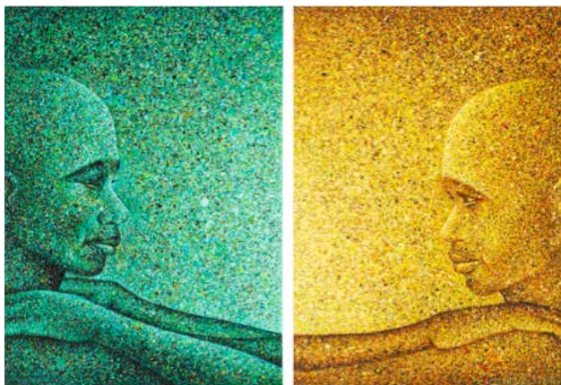
«Ich bin, weil du bist» – Das neue Hungertuch des nigerianisch-deutschen Künstlers Chidi Kwubiri.