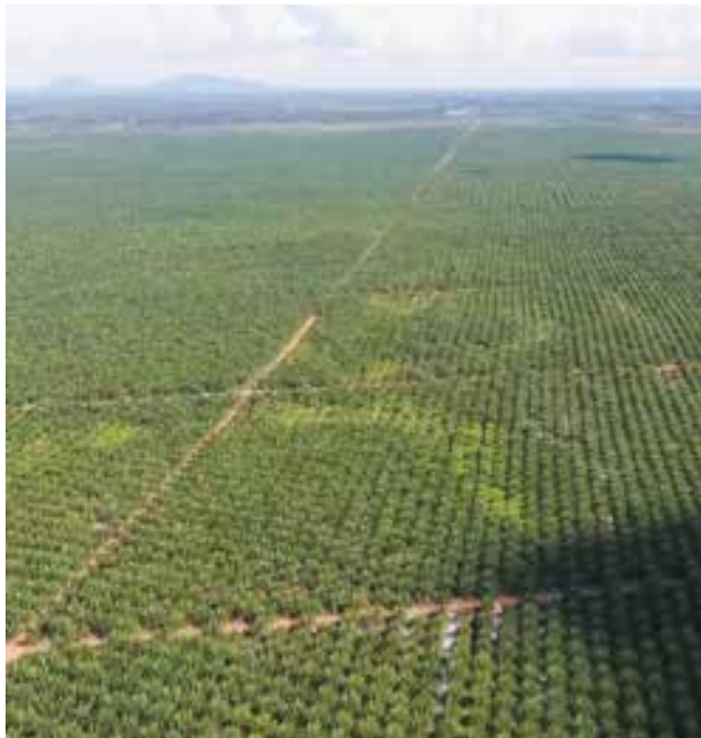
Wie ein Gespenst bedroht das Wachstum der Palmölindustrie in Kalimantan die ansässige Bevölkerung. Ständig werden neue Plantagen angelegt.

Land Grabbing nimmt den Bäuerinnen und Bauern das Land. Sie können es nicht mehr selbstbestimmt nutzen und ihre Ernährung sicherstellen. Das ist aber für viele Menschen die Voraussetzung, um ein Leben in Würde zu führen. Sie verlieren damit nicht nur ihre Existenz, sondern auch ihre Zuversicht.